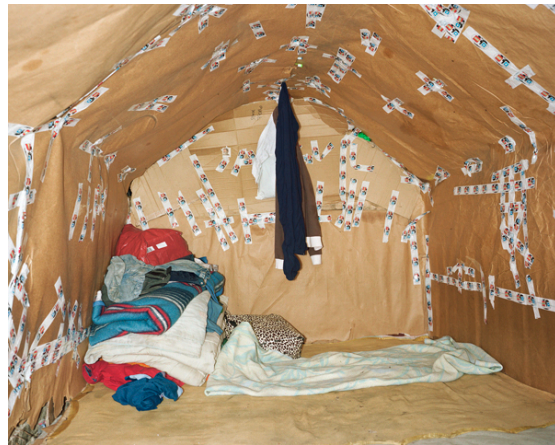
Foto 3 en 4 zijn gemaakt door fotograaf Henk Wildschut in "the jungle" van Calais. Het zijn tenten gemaakt van restafval. Hij zegt: "For me, the image of the shelter – wherever it is in Europe – became the symbol of the misery these refugees experience"

De schilderijen zijn te bezichtigen bij ons op school. Wat vind jij: geven deze afbeeldingen de ellende van de vluchtelingen goed weer? Waarom wel of niet?